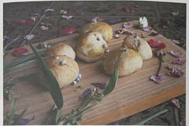
Pão de Lógrima, da série Esculturas de Lógrimas, 2021.