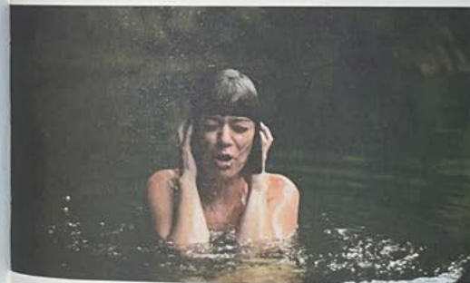
Microfone para chorar, da série Esculturas de Lógrimas, 2021.